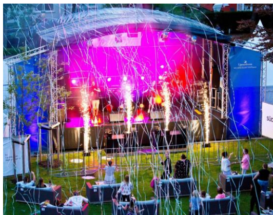
Eines von vielen Highlights im vergangenen Jahr auf dem Südstrand Open Air: der Auftritt des Duos „Gestört aber Geil“.