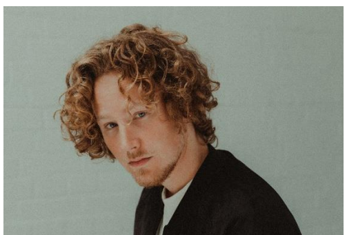
Michael Schulte erreichte 2018 den 4. Platz beim Eurovision Song-Contest und feiert im August seine Premiere auf Föhr.