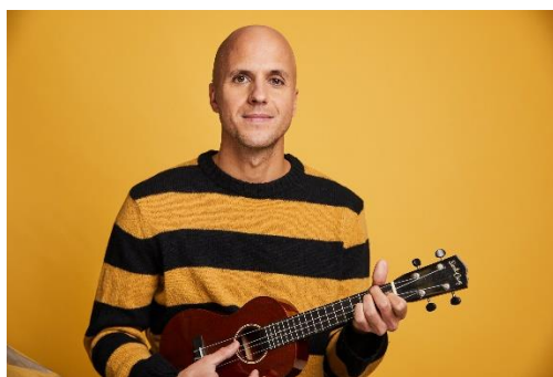
Milows Hits „Ayo Technology“ und „Whatever it takes“ stürmten die Charts weltweit.

Weitere Informationen finden Sie auch im Internet unter resort-suedstrand-foehr.de