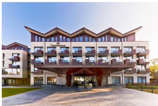
Ort des Geschehens: das Upstalsboom-Hotel auf Föhr am Wyker Südstrand