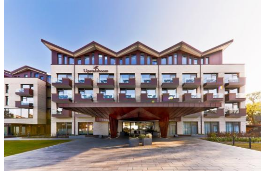
Ort des Geschehens: das Upstalsboom-Hotel auf Föhr am Wyker Südstrand