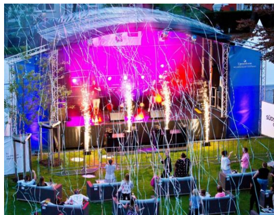
Eines von vielen Highlights im vergangenen Jahr auf dem Südstrand Open Air: der Auftritt des Duos „Gestört aber Geil“.